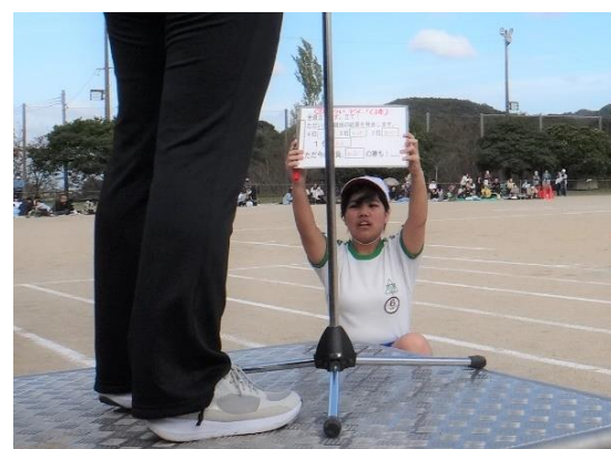
記録係: 先生が見やすいように気をつけます。