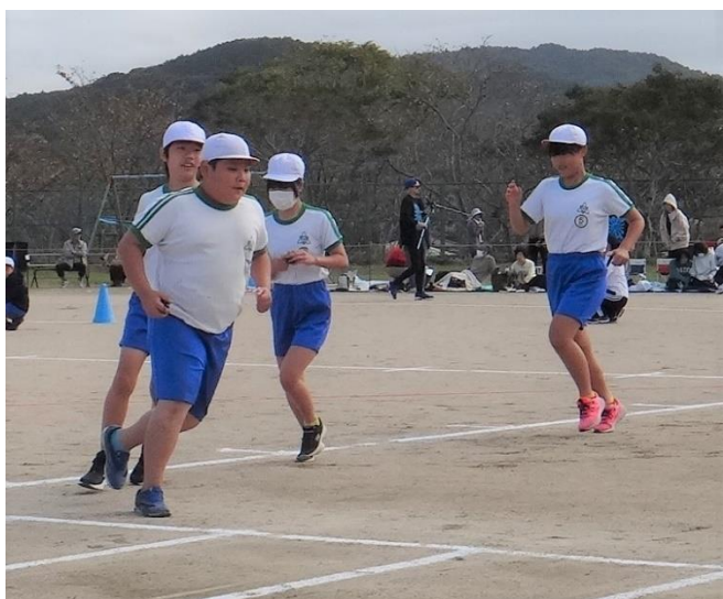
演技進行係: 移動も いつも全力です。気持ちいい！