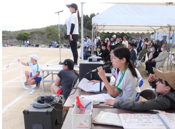
放送係: ステキな声を、運動場にひびかせます。