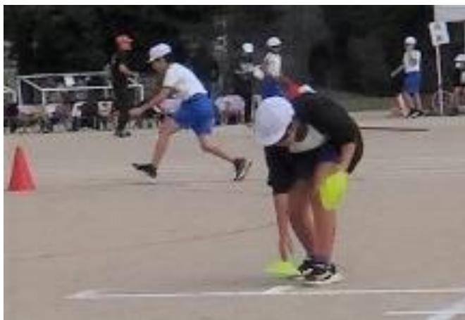
用具係: 次の競技のマーカ―を 設置します。