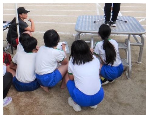
記録係: 競技の記録中 間違えないように正確に！