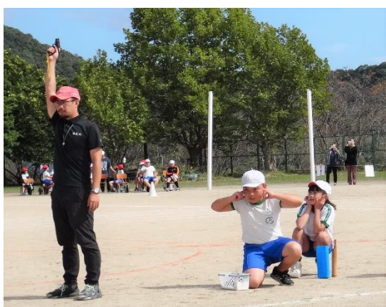
演技進行係: 信号機(ピストル)の 準備をします。