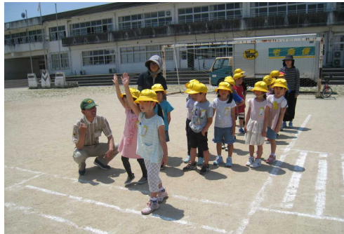
▲横断歩道はきちんと手を挙げて!

去る5月24日(金)、1年生と4年生を対象に「交通安全教室」を行いました。今回は、国内有数の物流会社の1つから講師を招き、横断歩道を渡る際の注意点や自転車の正しい乗り方・運転の仕方を教わりました。今や、一歩外に出ると危険がいっぱい待ち構えている世の中です。今回の学習を契機に、安心・安全への意識を一層高揚させると共に自助・共助への考えを身に付けていきたいと思ひます。