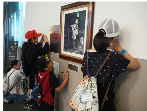
▲戦争当時の聴き取り・書き取り

去る5月22日(水)・23日(木)、6年生が1泊2日の日程で長崎を訪れました。1日目は、「平和」をテーマとした学習を組み、現地の歴史的・文化的遺産の見学とフィールドワークを行いました。併せて、過去の戦争体験から平和へのメッセージを訴え続けてこられた「語り部」の方からの貴重な講話を聴きとってきました。現地では「平和集会」も開催し、全校の子どもたちで作った「折り鶴」を捧げ、平和への誓いを世界に発信しました。2日目の大型テーマパークでのグループ別行動も楽しく過ごしました。